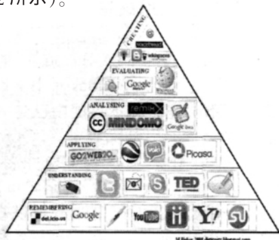
图 1 数字布鲁姆 2009 版

布鲁姆教育目标分类学一直是教育技术理论和实践的指导性原则。2001 年,L·W·安德森和 D·R·克拉斯沃尔在《学习、教学和评估的分类学——布鲁姆教育目标分类学修订版》一书中,将布鲁姆认知领域的教育目标分类修订成了“识记、理解、应用、分析、评价、创建”6 个层次 [1] 。美国教育专家 Michael Fisher 根据这一新的目标分类在 2009 年首次提出了“数字布鲁姆”的图示(如图 1 所示)。之后他和他的团队又根据英国学习和绩效技术中心网站(www.c4lpt.co.uk)上他人提出的“可用于学习的 25 个工具”修改了原来的版本,形成了新的“数字布鲁姆”(如图 2 所示)。