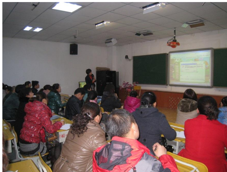
夏维娜老师在做中高年级语文培训

总之，本次培训取得了很好的效果，课题教师之间相互交流、相互鼓励都反映收获很大。以下为部分培训照片。