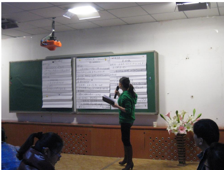
各组代表在进行说课