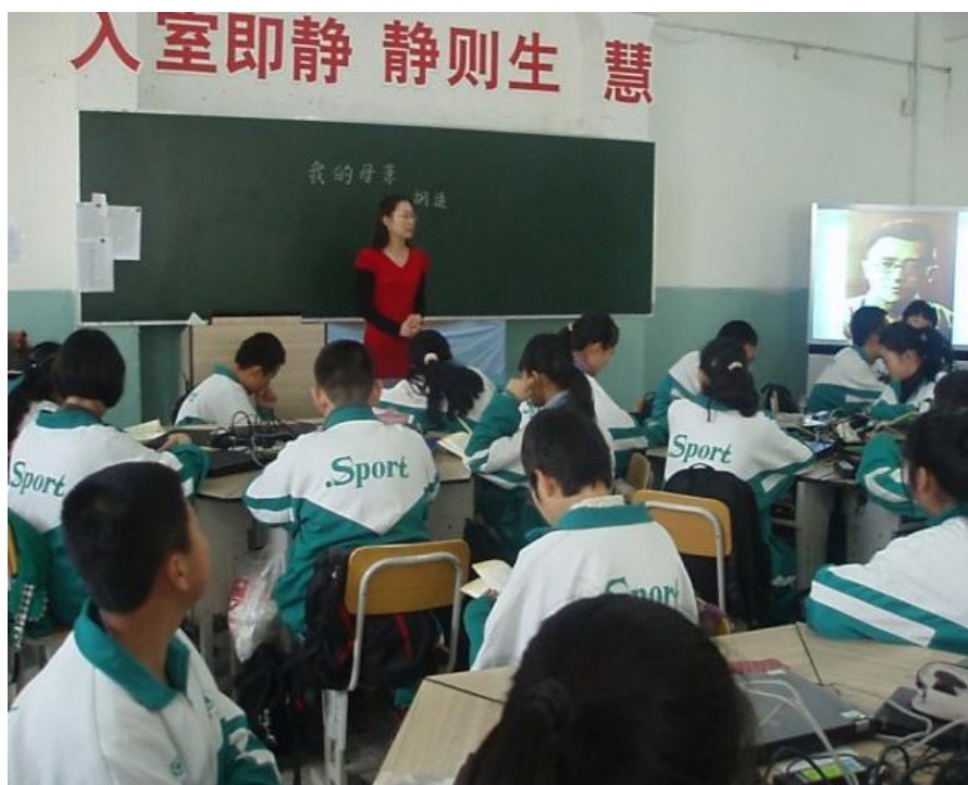
初中教师网络班上课