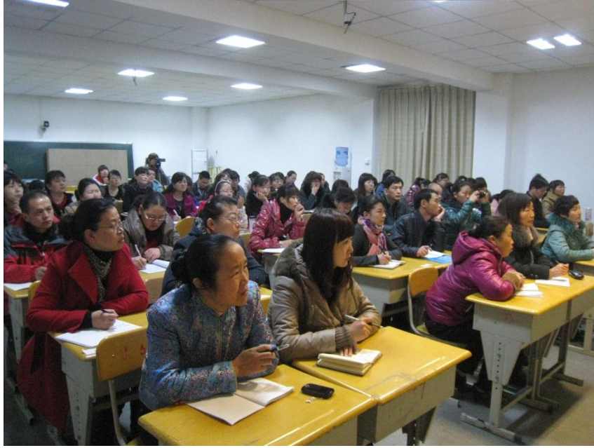
团场老师在认真学习