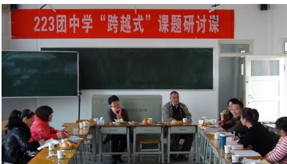
223 团愉快的研讨氛围