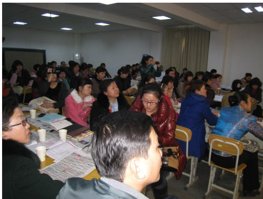
其他各组认真聆听并做点评