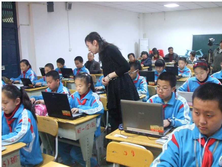
语文精加略听课研讨现场