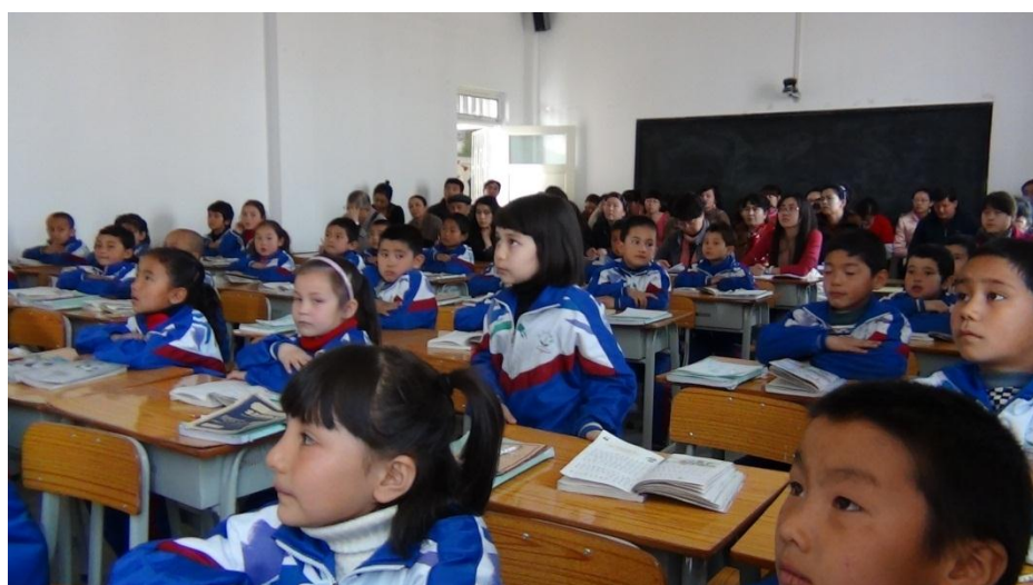
大眼睛女孩在思考问题