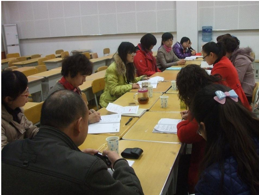
小学数学研讨现场

本次为期 14 天的课题指导工作已经结束，在课题指导过程中，无论是总课题组的各个成员，还是农二师教育局、或者是农二师 23 所课题实验学校的老师都十分投入本次活动中，按照课题组的要求提交资源，积极参与，认真思考。为了课题的进一步扎实的推进，总课题组提出了 2 点希望：