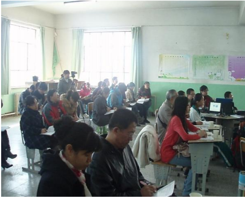
何教授和相关老师们一起参与听课