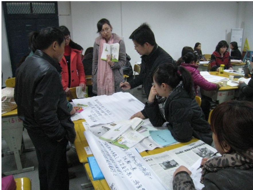
华山老师和团场老师们一起进行中高年级集体备课