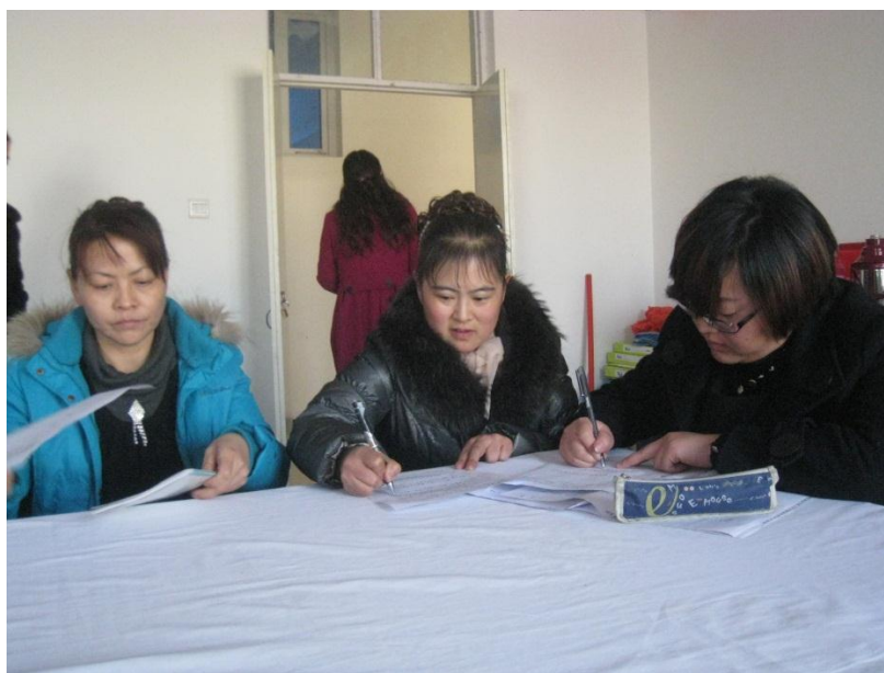
课题老师在一起交流研讨课