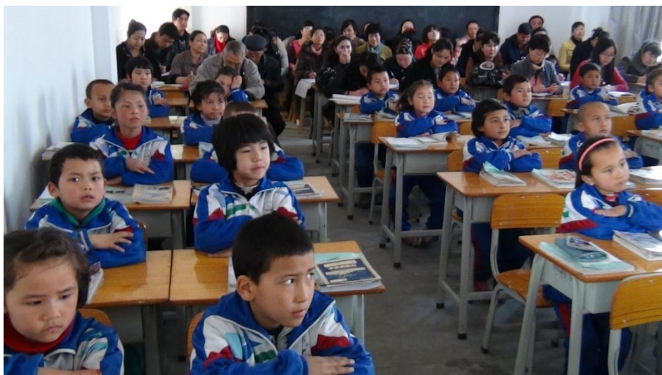
何教授以及刘局长在教室听课