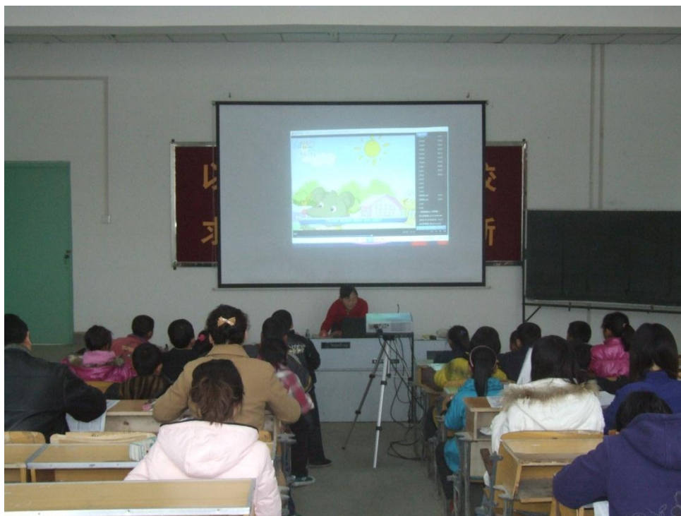
35 团英语老师在上课