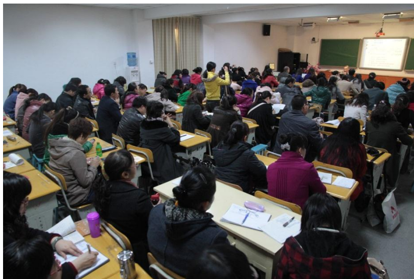
全场老师认真聆听并做笔记