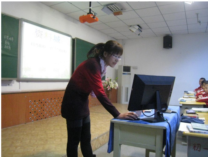
老师们进行借班上课