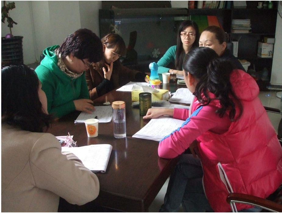
小学英语研讨课现场