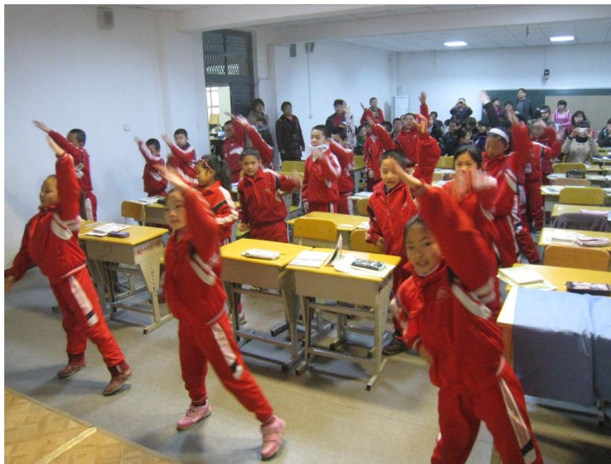
可爱的孩子们在做活动操